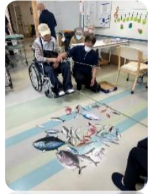
久しぶりの 魚釣りゲームです