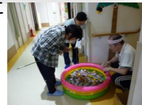
★缶つり！ 簡単そうでこれがなかなか難しい ★やっぱり人気のかき氷！お好みはどの味でしょう

イチジク 栗に ほくほくと美味しいお芋！ 秋の味もそろそろとお目見えしてきました 敬老会も予定しています そんな秋を満喫できますように これからも元気で過ごしたいですね！