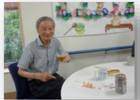
★ノンアルでもビールの味は格別です！

イチジク 栗に ほくほくと美味しいお芋！ 秋の味もそろそろとお目見えしてきました 敬老会も予定しています そんな秋を満喫できますように これからも元気で過ごしたいですね！