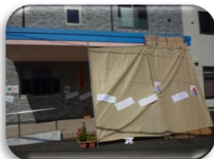
輪投げのコーナー