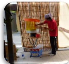
綿菓子コーナー 甘い香りで いっぱいでした